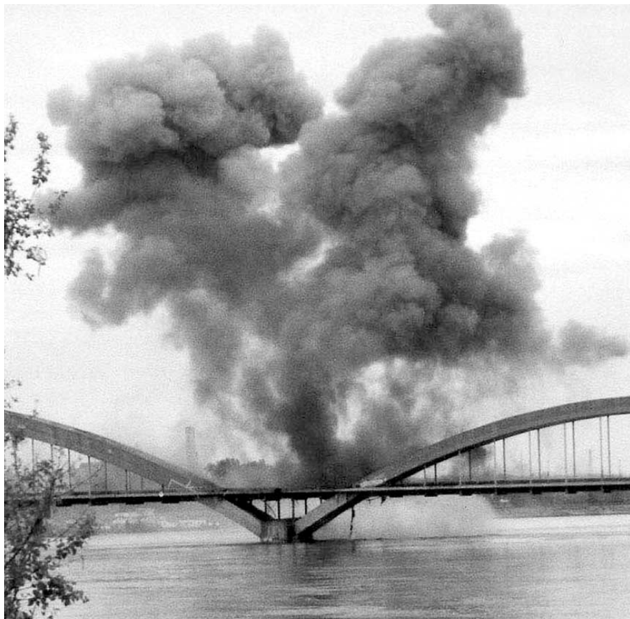
Loftárásir NATO á hernaðarleg mikilvæg mannvirki.

ekki má lengur nota orðið "stríð" yfir hernaðaríhlutun. Ástæðan er sú að það yrði miklu erfiðara fyrir vestræna ráðamenn, eins og t.d. Bandaríkjaforseta, að fá skýrt lagalegt umboð til stríðsreksturs. 14 Síðast en ekki síst er almenn-ingur á Vesturlöndum ekki reiðubúinn að færa stríðsfórnir. Það var makalaust hve daglegt líf fólks breyttist lítið í vestrænum ríkjum meðan á loftárásunum stóð. Vestrænir valdamenn lærðu þá lexíu af Víetnamstríðinu að vonlaust væri að halda stuðningi almennings við stríðsaðgerðir ef mannfali yrði mikið eins og kom berlega í ljós í Persaflóastríðinu og Kosovo-stríðinu.