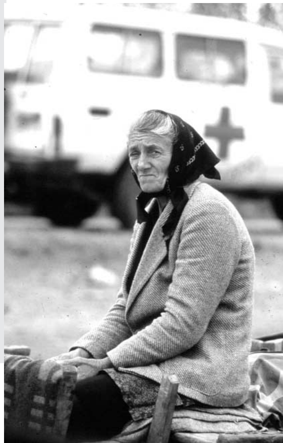
Átökin á Balkanskaga hafa beint athyglinni að hlutskipti kvenna sem fórnarlamba stríðsglæpa.

Barátta Rauða krossins gegn vopnum, sem valda óþarfa meiðslum, hefur miðað vel eftir lok Kalda stríðsins. Þann 1. mars 1999 gekk Ottawa samningurinn um bann við jarðsprengjum í gildi. Hann hefur nú lagagildi og á tveggja ára afmæli samningsins 1. mars 2001 höfðu 111 ríki