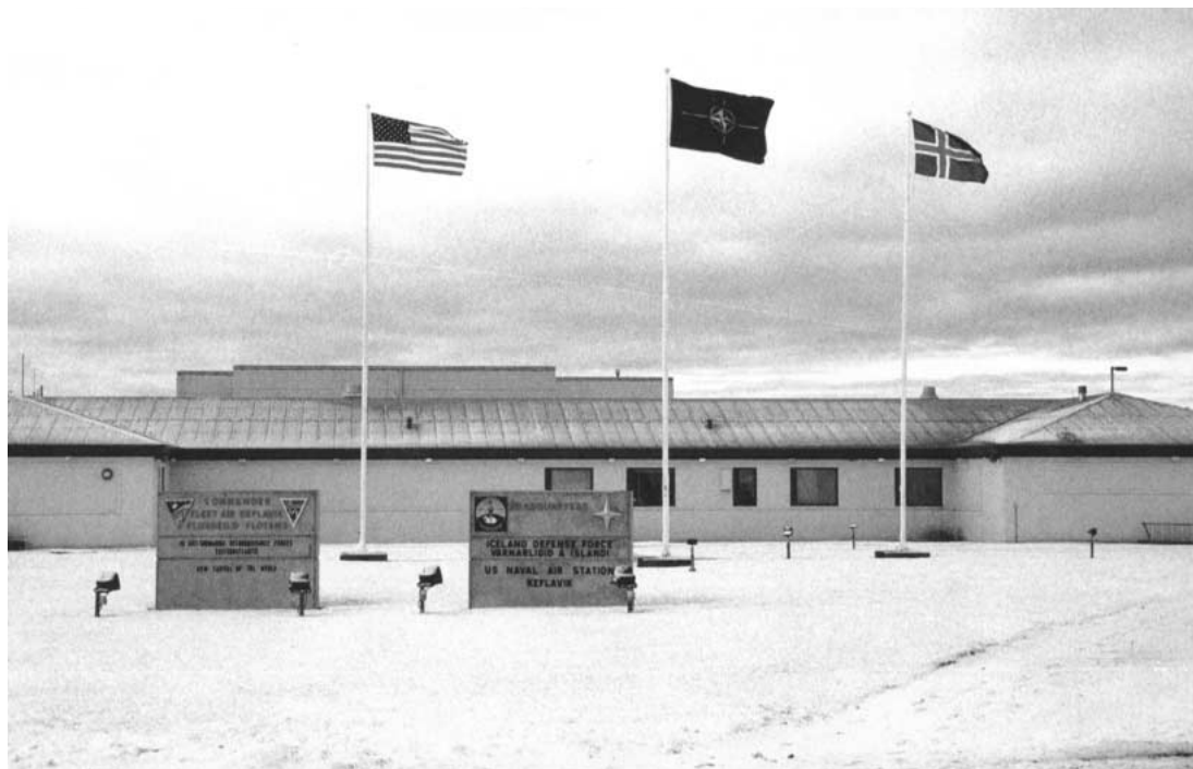
Fánar Íslands, NATO og Bandaríkjanna blaka við hún fyrir framan höfuðstöðvar Varnarliðsins á Íslandi.

But none of them has even hinted that the United States should leave either alliance: NATO or the 1951 US-Iceland Defence Agreement. That is because the realists have to acknowledge a good deal of what the institutionalists and liberals argue. Values and institutions matter at least as much, possibly more than power. Indeed values and institutions are themselves a source of power.