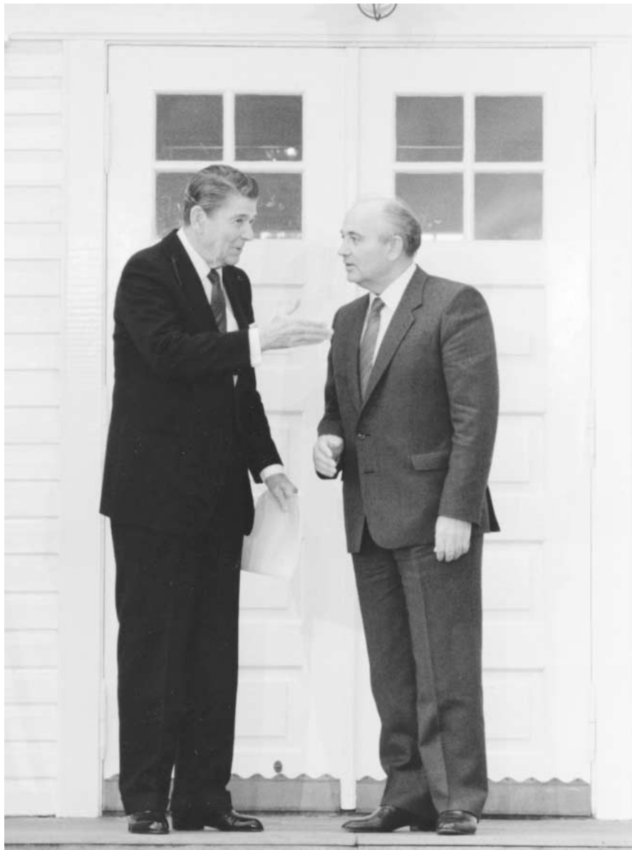
Leiðtogafundurinn í Höfða 1986, sem markaði upphafið að lokum Kalda stríðsins.

Íslendingum hefur orðið tíðrætt um sérstöðu sína sem vopnlausrar þjóðar með afstöðu hvort tveggja til austurs og vesturs. Þótt slíkar lýsingar geti orðið æði klisjukenndar er vert að gefa þeim gaum