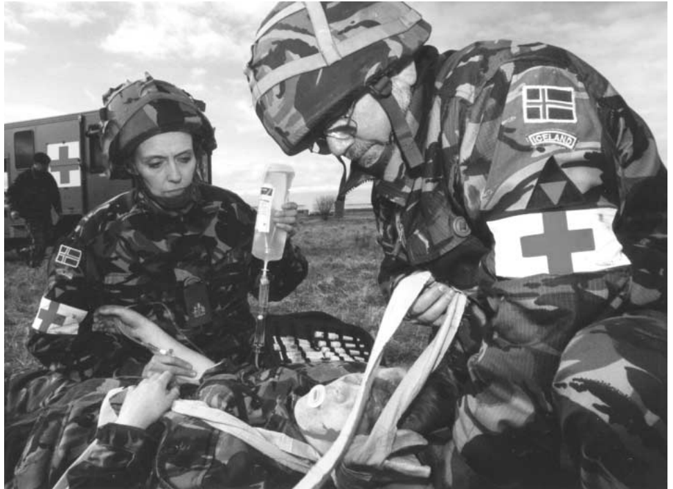
Íslenskir friðargæsluliðar í æfingabúðum í Bretlandi.

Gert er ráð fyrir að þátttaka í friðargæslu sé í samvinnu við hinar ýmsu alþjóðastofnanir eins og verið hefur þ.á.m. Sameinuðu þjóðirnar, Atlantshafsbandalagið og Öryggis- og samvinnustofnun Evrópu. Í þessu samhengi má ekki gleyma Evrópusambandinu sem í tengslum við þróun öryggis- og varnarmálastefnu sína miðar að því að geta kallað saman allt að 60 þúsund manna herlið til að takast á við ýmiss konar hættuástand sem upp getur komið í Evrópu eða annars staðar með skömmum fyrirvara. Evrópusambandið hefur boðið þeim ríkjum í NATO, sem ekki eiga aðild að sambandinu sem og þeim ríkjum sem sótt hafa um aðild, að taka þátt í aðgerðum sem það stendur fyrir annað hvort eitt sér eða í samvinnu við aðra aðila t.d. NATO. Af Íslands hálfu jafnt og annarra hefur verið tekið vel í þetta boð og jafnframt gefin fyrirheit um framlag þegar mikið liggur við og hefur í þeim efnum verið vísað til áforma um stofnun Íslensku friðargæslunnar.