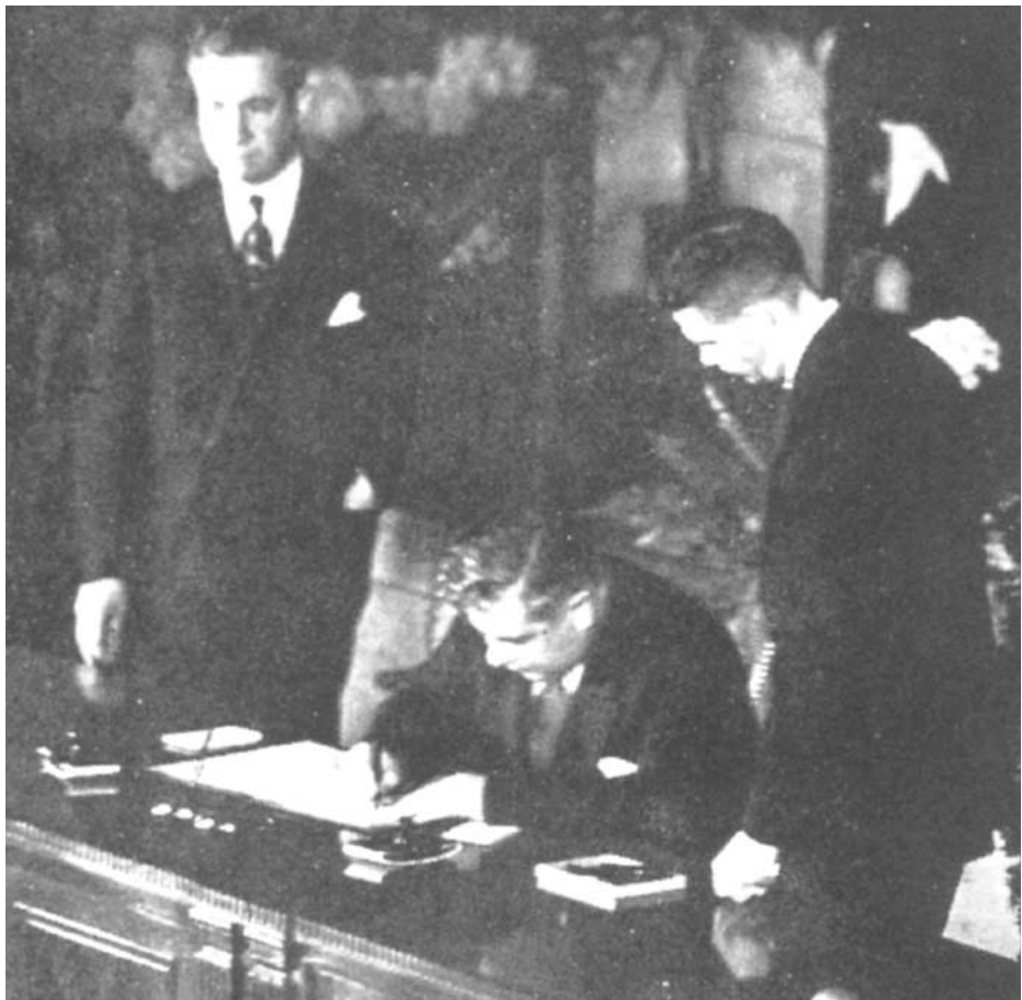
Utanríkisráðherra Íslands, Bjarni Benediktsson, undirritar stofnsáttmála NATO, 4. apríl 1949 í Washington.

Sama dag og utanríkisráðherrar NATO ræddu við nýjan utanríkisráðherra Bandaríkjanna fundaði framkvæmdastjóri NATO með háttsettum fulltrúum allra helstu stofnana sem starfa á Balkanskaga - Sameinuðu þjóðunum, Öryggis- og samvinnustofnun Evrópu, ESB og mannréttindastofnun Sameinuðu þjóðanna (UNHCR) - í höfuðstöðvum bandalagsins til að ræða helsta áhyggjuefni manna um þessar mundir, aukna