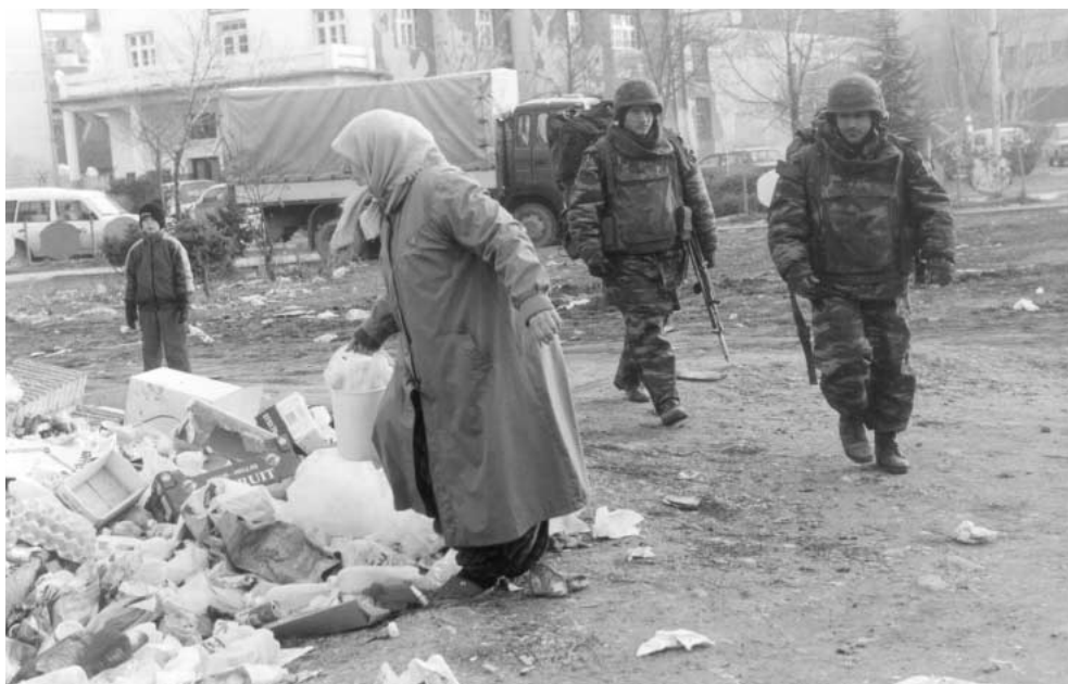
Daglegt brauð í Kosovo.

Var rétt að leggja allt þetta fé og allan þennan mannafla til að grípa inn í þróun sem margir segja að verði ekki stöðvuð? Var saga Balkanskaga ekki bara röð ofbeldisverka og mannréttindabrota og einfaldni að halda að hægt væri að breyta aldagömlum siðvenjum og hugarfari? Hvernig var hægt að réttlæta það að skipulögð glæpastarfsemi blómstraði í skjóli alþjóðastofnana, lögreglu og hers? Og sömu gagnrýnendur spurðu sjálfa sig hvor rétt hefði verið að refsfa heilli þjóð fyrir glæpi leiðtoga hennar?