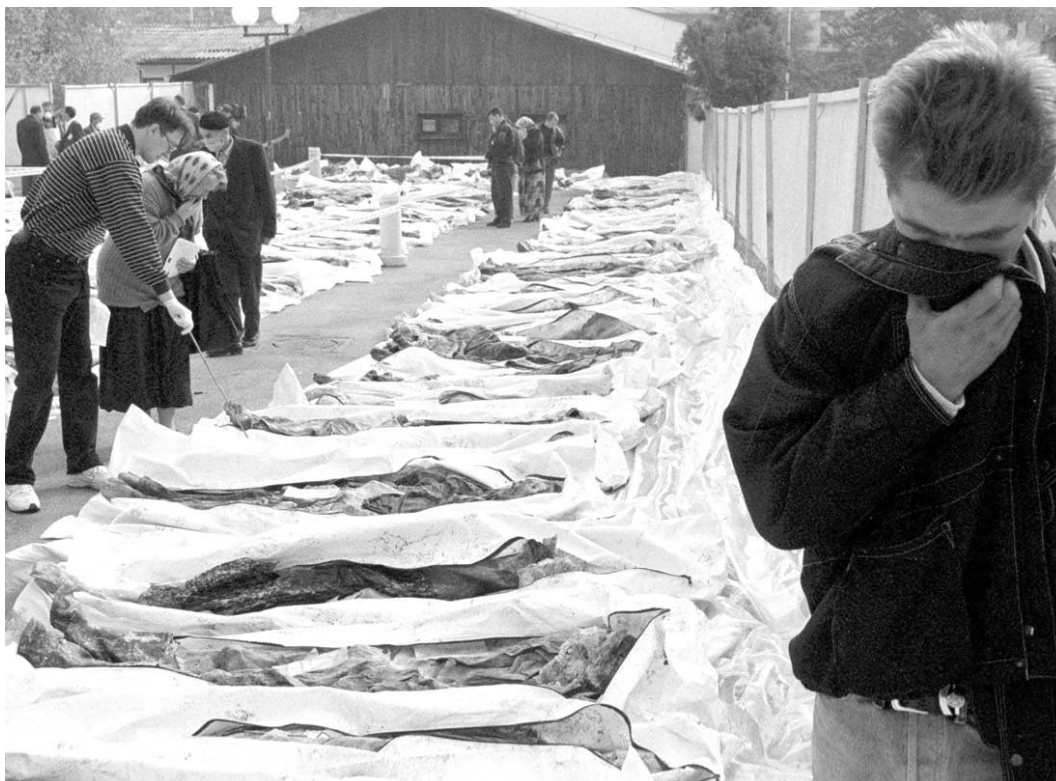
Fjölskyldur bera kennsl á lík í fjöldagröf í Bosníu árið 1998.

á Balkanskaga hefur það öðlast nýtt hlutverk. En Evrópuríkin voru fullkomlega háð Bandaríkjamönnum í hernaðaraðgerðum NATO í Kosovo. Þetta var „bandarískt stríð“ þar sem áherslan var lögð á loftárásir og á að koma í veg fyrir mannfall í eigin liði. Bretar höfðu þegar í upphafi hvatt til þess að hóttað yrði landhernaði en Bandaríkjamenn (og Þjóðverjar) töldu sig ekki geta það af innanlandspólitískum ástæðum.