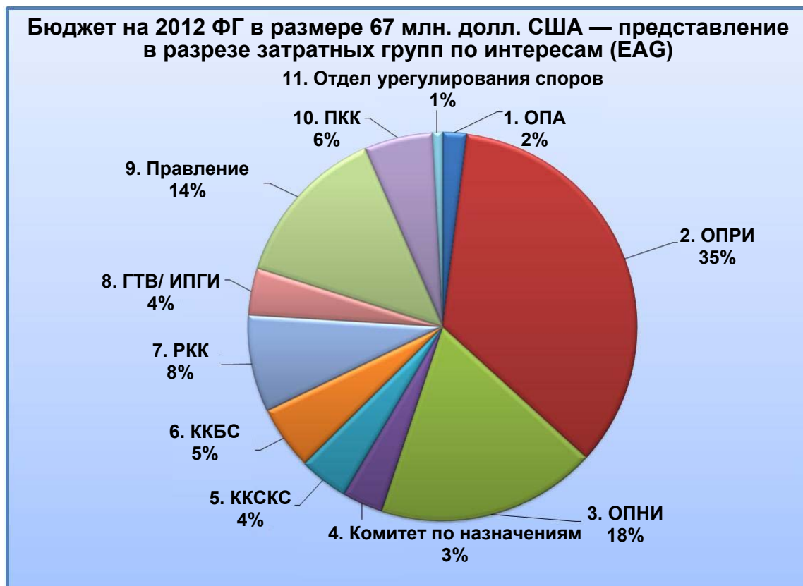
Рис. С-2. Представление в разрезе затратных групп по интересам (EAG)

Операционные расходы представлены в разрезе затратных групп по интересам (EAG). На этом представлении отражены расходы, сгруппированные по организациям поддержки и консультативным комитетам, а также другим органам ICANN в соответствии с организационной структурой корпорации.