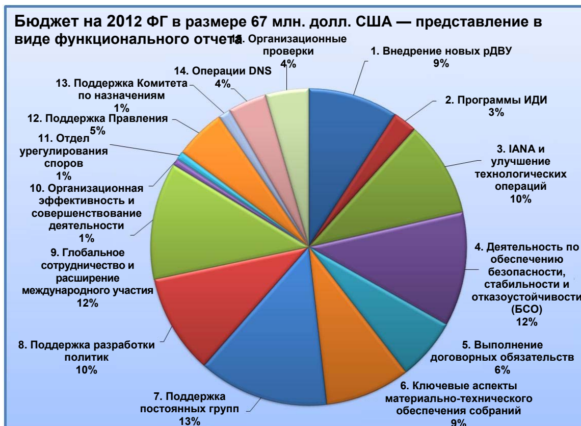
Рис. С-1. Представление в виде функционального отчета