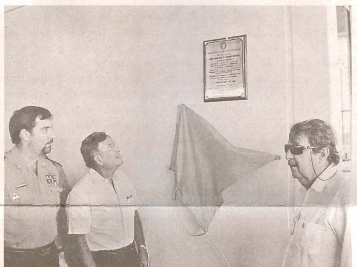
Dentro del acto también se develizó una placa para inaugurar el nuevo cuartel del Cuerpo de Bomberos.

El éxito de la compañía es algo que no me importaba. Creé computadoras para hacer del mundo un lugar mejor, así no hubieran tenido