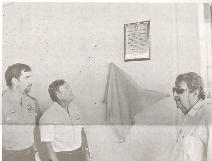
Dentro del acto también se develó una placa para inaugurar el nuevo cuartel del Cuerpo de Bomberos.

está instalada en el mismo edificio donde funciona el la Seguridad Ciudadana de Guayaquil. (NRS)