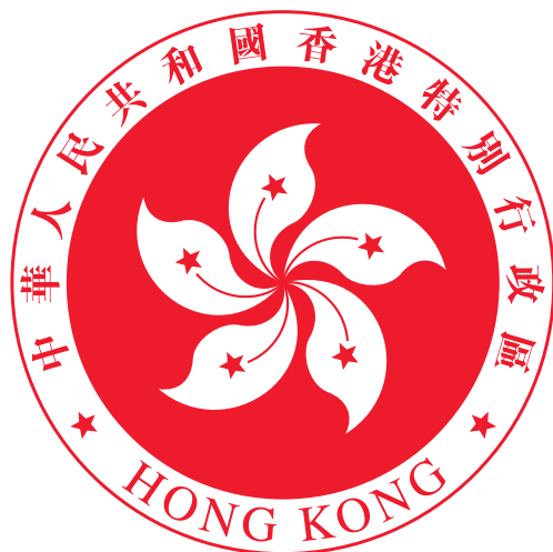
香港特別行政區區徽圖案