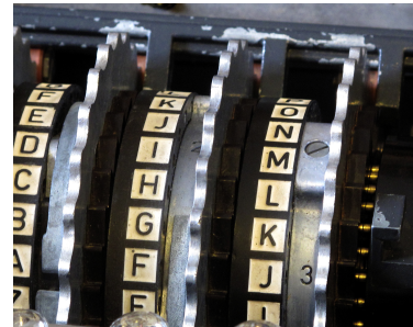
FIGURE 1 – Gros plan des rotors de la machine Enigma

Les primitives cryptographiques, telles que les fonctions de chiffrement et les signatures numériques, constituent les briques de base. On distingue deux familles : les primitives symétriques et asymétriques. La cryptographie symétrique suppose que les parties en communication partagent une clé secrète. Ce type de cryptographie est plus efficace que la cryptographie asymétrique, mais nécessite l'échange préliminaire de la clé secrète. La cryptographie asymétrique, ou à clé publique, ne nécessite pas cet échange, car la clé publique (utilisée pour le chiffrement ou pour la vérification d'une signature) n'a pas besoin de rester secrète. L'utilisation de ces deux types de primitives est complémentaire. Une approche typique