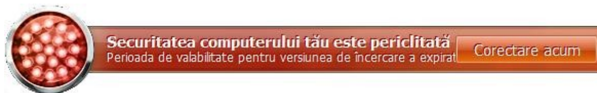
Figura 1: Starea curentă a protecției computerului

Starea protecției computerului indică problemele legate de protecția computerului, care sunt afișate în după modificările în culoarea pictogramei stării de protecție și în panoul pe care este amplasată pictograma. Dacă apar probleme în sistemul de protecție, recomandăm remedierea imediată a acestora.